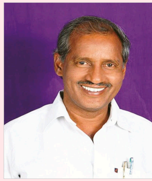
సుజాతనగర్ మండలంలోని ఏడు పంచాయతీలను విలీనం చేసి కార్పొరేషన్ ను ఏర్పాటు చేసిన విషయం

తెలిసిందే. అయితే, ఈ సూతన కార్పొరేషన్ కు కేవలం కొత్తగూడెం పేరు మాత్రమే ఉందని, పాల్వంచ పేరు చేర్చాలని అక్కడి ప్రజలు కోరుకుంటున్నారని, వారి మనోభావాలను గౌరవిస్తూ పేరు మార్చాలని ఎమ్మెల్యే కోరారు. పాల్వంచకు ఘనమైన చరిత్ర ఉందని, గతంలో ఇది ఒక సంస్థానంగా, ప్రత్యేక అసెంబ్లీ నియోజకవర్గంగా విరాజిల్లిన విషయాన్ని ఆయన గుర్తు చేశారు. అటువంటి చారిత్రక ప్రాధాన్యత కలిగిన పాల్వంచ పేరును కార్పొరేషన్ లో చేర్చడం ద్వారా ఆ ప్రాంత గౌరవాన్ని, ప్రజల ఆత్మగౌరవాన్ని కాపాడినట్లువుతుందని కూనంనేని పేర్కొన్నారు. కార్పొరేషన్ పేరు మార్పు విషయంలో పాల్వంచ ప్రజల కోరిక అత్యంత సమంజసమని, ప్రభుత్వం సానుకూలంగా స్పందించి తక్షణమే అసెంబ్లీలో తీర్మానం ప్రవేశపెట్టాలని ఆయన డిమాండ్ చేశారు. త్వరితగతిన 'కొత్తగూడెం-పాల్వంచ మున్సిపల్ కార్పొరేషన్'గా అధికారిక ప్రకటన వెలువడేలా చర్యలు తీసుకోవాలని ముఖ్యమంత్రిని కోరుతూ పంపిన లేఖలో ఆయన వివరించారు.