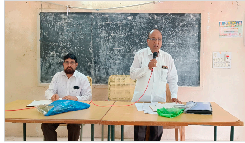
బోధన్ డివిజన్ ఉప విద్యాకాఖ అధికారి కార్యాలయం సమావేశపు హాలులో శనివారం రోజున బోధన్ మండలంలోని ప్రభుత్వ ప్రైవేటు, ఎయిడెడ్, మైనార్టీ