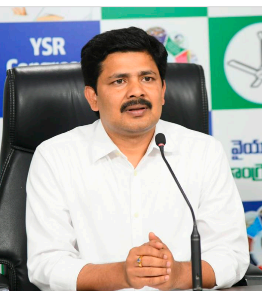
పరిశ్రమలకు ముడి పదార్థాలు ఇవ్వని రైతుపైనే ఆధారపడి

రైతుల ఆదాయాన్ని పెంచేందుకు పంట కోత అనంతరం అవసరమైన నిల్వ, ప్రాసెసింగ్, మార్కెటింగ్ మౌలిక వసతులు అత్యంత కీలకమని తిరుపతి ఎంపీ మద్దిల గురమూర్తి అభిప్రాయపడ్డారు. కేంద్ర ప్రభుత్వం అమలు చేస్తున్న అగ్రికల్చర్ ఇన్ ప్రాస్పెక్టర్ ఫండ్ (ఏఐఎఫ్) పథకం ద్వారా రైతులకు, రైతు ఉత్పాదకులకు సంఘాలకు, స్వయం సహాయక సంఘాలకు, వ్యవసాయ రంగంలో పనిచేస్తున్న సంస్థలకు దీర్ఘకాలిక రుణ సౌకర్యాన్ని అందిస్తోందని ఆయన పేర్కొన్నారు. ఈ పథకం ద్వారా గోదాములు, కోల్డ్ స్టోరేజీ యూనిట్లు, ఫుడ్ ప్రాసెసింగ్ కేంద్రాలు, గ్రీడింగ్, ప్యాకింగ్ యూనిట్లు వంటి మౌలిక వసతుల నిర్మాణానికి బ్యాంకుల ద్వారా రుణాలు లభిస్తాయని, వాటిపై 4 శాతం వరకు వడ్డీ రాయితీ, క్రెడిట్ గ్యారంటీ సదుపాయం కూడా ఉంటుందని వివరించారు. భారతదేశం వ్యవసాయ ఆధారిత దేశం. ఆహార భద్రత, గ్రామీణ ఉపాధి,