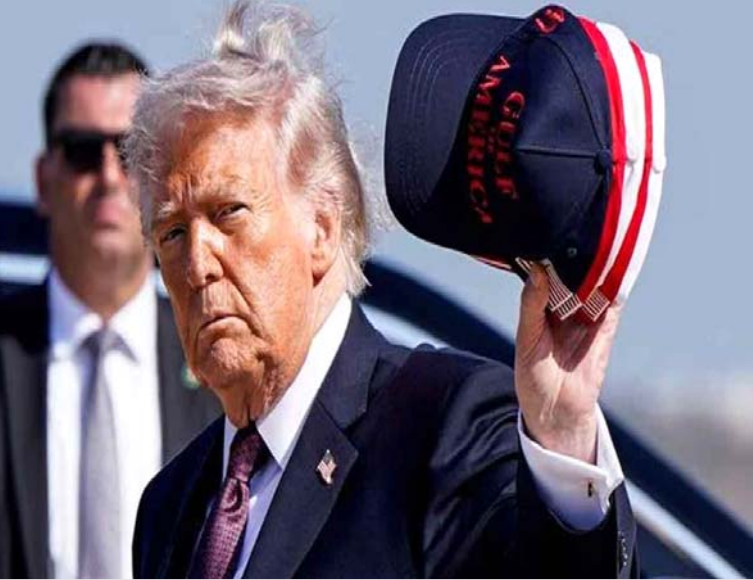
> మిగతా 2వ పేజీలో..

న్యూఢిల్లీ జనసంఘర్షణ అమెరికా అధ్యక్షుడు డొనాల్డ్ ట్రంప్ మరోమారు ఇరాన్ కు హెచ్చరికలు జారీ చేశారు. ఇరాన్ సుప్రీం లీడర్ ఖమేనీ మృతి అనంతరం అమెరికా, ఇజ్రాయెల్ పై ప్రతీకారం తీర్చుకుంటామని ఆ దేశ ప్రభుత్వం హెచ్చరికలు చేసిన నేపథ్యంలో ట్రంప్ స్పందించారు. ఇరాన్ ప్రతీకారానికి దిగకపోవడమే మంచిదని అన్నారు. ప్రతిదాడులు చేస్తే పరిణామాలు మరింత తీవ్రంగా ఉంటాయని, ఈసారి ఊహించని రీతిలో దాడులు చేస్తామని హెచ్చరించారు. ఇరాన్ ప్రతిదాడులకు పాల్పడితే తమ నుంచి ఈసారి స్పందన మరింత ఎక్కువగా ఉంటుందని, చరిత్రలో ఎవరూ ఇప్పటి వరకు ఉపయోగించని విధంగా భారీ ఎత్తున సైన్యంతో దాడులకు పాల్పడతామని అన్నారు. ఈ మేరకు ట్రంప్ తన ట్రూత్ సోషల్ మీడియాలో పోస్టు పెట్టారు. అంతకు ముందు ఇరాన్ కు చెందిన ఇస్లామిక్ రివల్యూషనరీ గార్డ్ కార్ప్స్ (ఐఆర్జీసీ), ఇస్లామిక్ రిపబ్లిక్ ఆర్మీ తమ నాయకుడి మృతి పట్ల తీవ్ర విచారం వ్యక్తం చేస్తూ, అమెరికా, ఇజ్రాయెల్ పై ప్రతీకారం తీర్చుకుంటామని, వారు ఖమేనీ మృతికి మూల్యం చెల్లించుకోవాల్సిందేనని ప్రకటనను విడుదల చేశాయి. అమెరికా చర్యలు హద్దు మీరాయని, వారు అత్యంత క్రూరులుగా మారారని, చరిత్రలో ఇలాంటి హేయమైన చర్యను ఎన్నడూ చూడలేదని పేర్కొన్నారు. ఖమేనీ చూపిన బాటలోనే తాము నడుస్తామని స్పష్టం చేశాయి. కాగా ఖమేనీ హత్యకు నిరసనగా ఆదివాక్యం