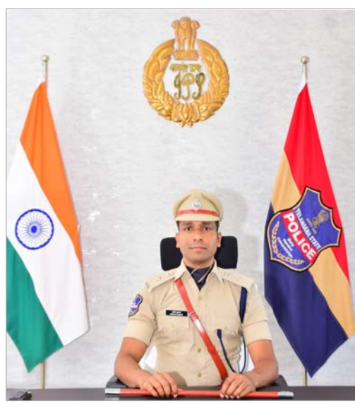
కేసులు ఉండొచ్చనే భయంతో గాయపడిన వారికి