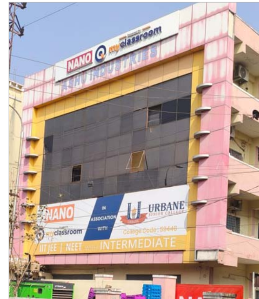
నడుపుతున్నారని వారు దృఢమెత్తారు. అందుకే ఇంటర్ బోర్డ్ సదరు కళాశాలపై కఠిన చర్యలు తీసుకోవాలని వారు డిమాండ్ చేశారు. అదేవిధంగా 2026 విద్య