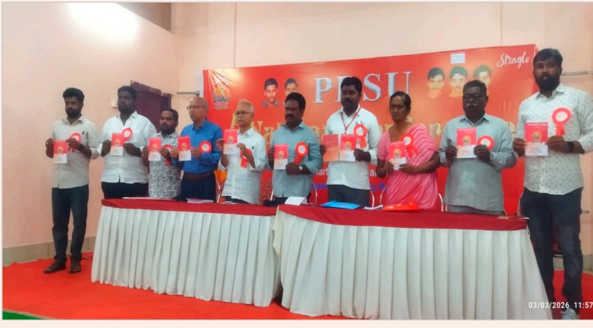
అలవాట్లు ఉన్న భారతదేశ ప్రజలపై హిందూ మత ఆధిపత్యాన్ని కొరకుంటున్నారని ఇది భారత రాజ్యాంగ మూల సూత్రాలకు వ్యతిరేకమైనదని అందుకే భారత రాజ్యాంగాన్ని మార్చాలని మార్గదర్శకాలను కూడా వ్యతిరేకించేది బిజెపి ఆర్ఎస్ఎస్ వంటి సంఘ పరివార శక్తులేనని అన్నారు.

దేశాన్ని తిరోగమనం వైపు నడిపించే విధానాలని అన్నారు. వర్ణాశ్రమ ధర్మం ప్రకారం ఏ హక్కులైతే ఉంటాయో వాటిని ప్రజలంతా పాటించాలని మెజారిటీ మతం పేరుతో ఫాసిస్ట్ విధానాలను అమలు చేస్తున్నారని దీనికి వ్యతిరేకంగా విద్యార్థుల ప్రశ్నించాలని అన్నారు. ప్రపంచంలో ఈరోజు ఆమెరికా , ఇజ్రాయిల్ కలసి ఇరాన్ పై సంయుక్త గగనతల దాడులు చేసి ఇరాన్ దేశాధినేత ఖమేని నీ అంతర్జాతీయ న్యాయ సూత్రాలకు విరుద్ధంగా హత్య చేయడం గురించి ప్రజాస్వామిక వాదులు మాట్లాడితే బంగ్లాదేశ్ హిందువుల దాడి గురించి ఎందుకు మాట్లాడటం లేదని సంఘ పరివార్ శక్తులు ప్రశ్నిస్తున్నాయని ఎక్కడ అన్యాయం జరిగినా మాట్లాడేది కేవలం కమ్యూనిస్టులు మాత్రమే అని అన్నారు. రమణయ్య హిందూ సంస్కృతి అంటే కేవలం విద్యోగం, విద్యుత్తుల మాత్రమేనని అన్నారు. ఈ నిచ్చిన మెట్ల కుల వ్యవస్థను దేవుడే సృష్టించాడని మార్చడానికి మనం ఎవరమని చెబుతున్నారని బెనారస్ హిందూ యూనివర్సిటీలో చేతబడి కర్మకాండల, జ్యోతిషం వంటి కోర్సులు ప్రవేశపెట్టి విద్యార్థులను ఏ రకమైన అభివృద్ధి వైపు నడిపిస్తున్నారని ప్రశ్నించారు. ఇలాంటి వ్యవస్థకు వ్యతిరేకంగా విప్లవ విద్యార్థులు పనిచేయాల్సిన అవసరం ఉందని తెలిపారు.