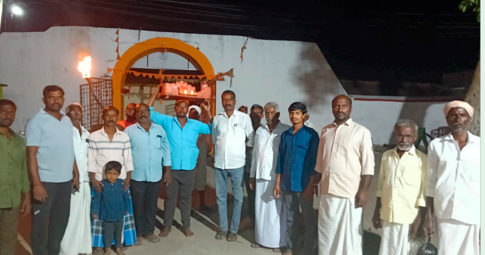
లింగంపేట్ మార్చి 04 (జనసంఘర్షణ)