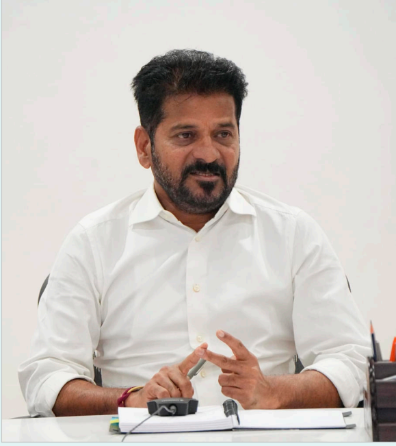
బోగస్ ఉద్యోగుల పేర్లతో జీతాలు పొందిన అవుట్సోర్సింగ్ ఏజెన్సీలపై వెంటనే క్రిమినల్ కేసులు

నమోదు చేయాలని సీఎం స్పష్టంగా ఆదేశించారు. అక్రమాలకు పాల్పడిన వారిని ఏ మాత్రం వదిలిపెట్టబోమని, బాధ్యులపై కఠిన చర్యలు తప్పవని హెచ్చరించారు.