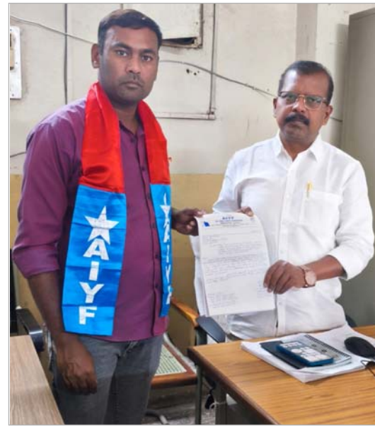
సంవత్సరానికి ముందే ఇంటర్ అడ్మిషన్లు చేపడుతున్నారని వీటిని కట్టిడి చేసి అర్బన్ కళాశాల గుర్తింపును రద్దు చేయాలని వారు డిమాండ్ చేశారు.