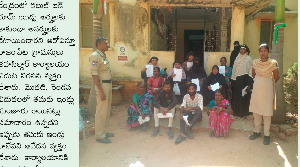
రాజంపేట : మార్చి 04 (జనసంఘర్షణ)