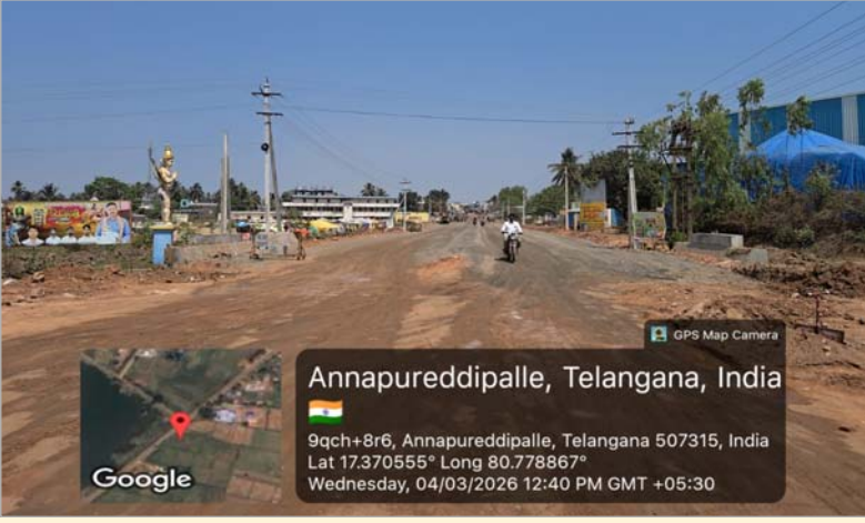
Annappureddipalle, Telangana, India

అన్నపూర్ణేశ్వరి మండల కేంద్రంలో నూతనంగా నిర్మిస్తున్న డబుల్ రోడ్ నిర్మాణ పనుల్లో కొలతలను తారుమారు చేసి పనులు చేపట్టడం పట్ల గ్రామస్థులు ఆందోళన వ్యక్తం చేస్తున్నారు. ప్రభుత్వ నిధులతో చేపట్టిన ఈ రోడ్డు నిర్మాణంలో నిబంధనలు పాటించకపోవడం వల్ల పనులు నాణ్యతపై సందేహాలు వ్యక్తమవుతున్నాయి. గ్రామ ప్రజల వివరాల ప్రకారం, రహదారి వెడల్పు మరియు పొడవు విషయంలో అధికారిక అంచనాలు ఒకలా ఉండగా, ప్రస్తుత నిర్మాణంలో కొలతలు తగ్గించి పనులు కొనసాగిస్తున్నట్లు ఆరోపిస్తున్నారు. గ్రామంలో కొంత ప్రాంతంలో రోడ్డు వెడల్పు తగ్గించడం గ్రామ శివారులో రోడ్డు కొలతలు మరో విధంగా ఉండటం విచిత్రంగా వుందని ఆవేదన వ్యక్తం చేస్తున్నారు. ఈ విషయమై సంబంధిత అధికారులను పలుమార్లు సమాచారం ఇచ్చినా ఇప్పటివరకు సరైన చర్యలు తీసుకోలేదని స్థానికులు విమర్శిస్తున్నారు. రోడ్డు నిర్మాణంలో వెడల్పు తగ్గిస్తే రానున్న రోజుల్లో రద్దీ పెరిగి ప్రమాదాలు జరిగే అవకాశం ఉంటుందని గ్రామ ప్రజలు ఆవేదన వ్యక్తం చేస్తున్నారు. ప్రభుత్వం కోట్ల రూపాయలు వెచ్చించి గ్రామాభివృద్ధి కోసం నిధులు మంజూరు చేస్తే కొందరు కాంట్రాక్టర్లు వారికి ఇష్టం వచ్చిన కొలతలతో రోడ్డు పనులు చేయడం దురదృష్టకరం అని అన్నారు. తక్షణమే ఉన్నతాధికారులు స్పందించి రోడ్డు పనులను సాంకేతిక నిపుణులతో పరిశీలించి సరైన కొలతలతో పునర్నిర్మాణం చేయాలని వారు డిమాండ్ చేశారు. ఇప్పటికైనా అధికారులు స్పందించి రహదారి నిర్మాణ పనులపై సమగ్ర విచారణ జరిపి బాధ్యులపై చర్యలు తీసుకోనీ రోడ్డు అంత ఒకే విధమైన కొలతలు ఉండే విధంగా నిర్మాణాలు చేసే విధంగా చూడాలని గ్రామ ప్రజలు కోరుతున్నారు.