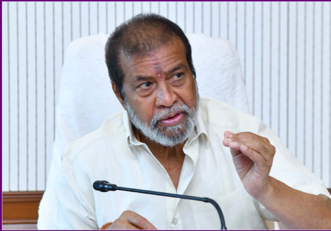
మిగతా 2వ పేజీలో..

హైదరాబాద్, మార్చి 4 జన సంఘర్షణ అంతర్జాతీయ మహిళా దినోత్సవాన్ని పురస్కరించుకుని రాష్ట్రంలోని స్వయం సహాయక సంఘాల మహిళలందరికీ హెల్త్ ప్రొఫైల్ రూపొందించాలని ప్రభుత్వం నిర్ణయించింది. ఈ నెల 8వ తేదీన ఈ భారీ కార్యక్రమాన్ని ప్రారంభించనున్నట్లు ఆరోగ్యశాఖ మంత్రి దామోదర్ రాజనర్సింహ ప్రకటించారు. బుధవారం సెక్రటేరియట్లో నిర్వహించిన 'ప్రజాపాలన-ప్రగతి ప్రణాళిక' సమీక్షా సమావేశంలో ఆయన అధికారులకు దిశానిర్దేశం చేశారు. ఈ పథకంలో భాగంగా టీ డయాగ్నోస్టిక్స్ ద్వారా ప్రతి మహిళకు 30 రకాల ఆరోగ్య