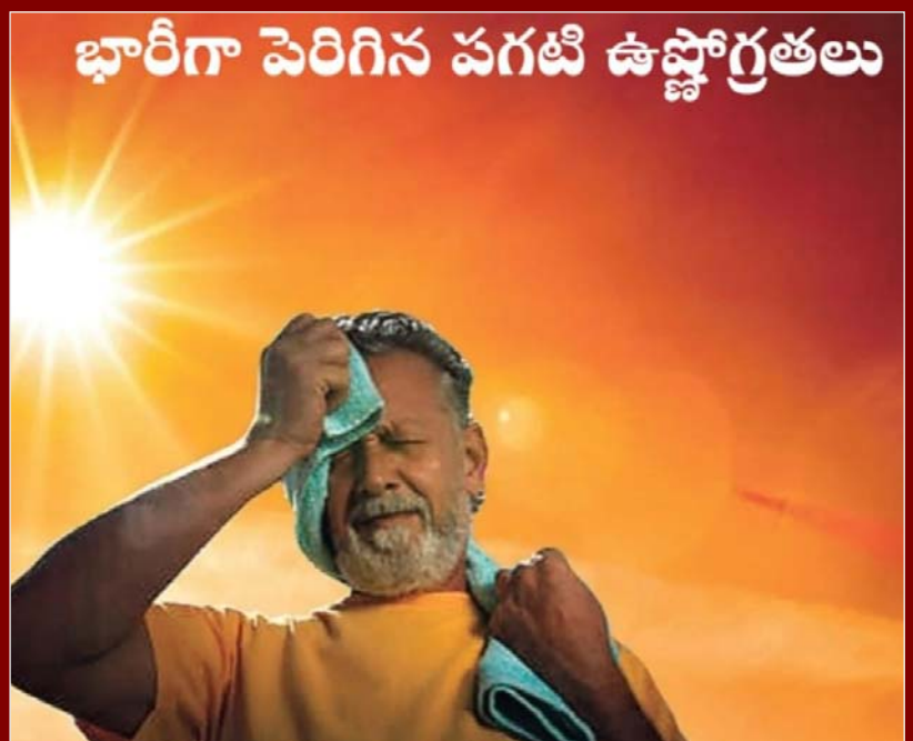
భారీగా పెరిగిన పగటి ఉష్ణోగ్రతలు

బోధన్: మార్చి 04, జన సంఘర్షణ ఎండలు మండుతున్నాయి. రోజురోజుకూ పగటి ఉష్ణోగ్రతలు పెరుగుతున్నాయి. మార్చి మొదటి వారం నుంచి ఎండల తీవ్రత క్రమంగా పెరుగుతోంది. ఉదయం 9 గంటల నుంచి ఎండ పెరుగుతూ మధ్యాహ్నం 12 గంటల సమయంలో తీవ్రరూపం దాల్చుతోంది. దీంతో జనం ఇబ్బంది పడుతున్నారు. జిల్లావ్యాప్తంగా సగటున 39 డిగ్రీల నుంచి 40 డిగ్రీల వరకు ఉష్ణోగ్రతలు నమోదవుతున్నాయి. ఎండల నుంచి ఉపశమనం పొందేందుకు ప్రజలు శీతల పానీయాల బాట పడుతున్నారు. ఎండా కాలం అప్పుడే ఉక్కుపోత మొదలైంది. ఉదయం పది గంటలు దాటితే సూర్యుడు సురుమంటున్నాడు. ఉమ్మడి జిల్లాలో సురుమంటున్నాడు. ఉమ్మడి జిల్లాలో మొన్నటి వరకు ఈదురుగాలులతో కూడిన చలి ఉండగా, నాలుగు రోజులుగా చలి మాయమైపోయి.. ఎండ తీవ్రత పెరిగింది. సాధారణ ఉష్ణోగ్రత కంటే ఎక్కువే నమోదు కావడం కలవరపరుస్తోంది. ఫిబ్రవరిలోనే ఎండలు మొదలైతే మే వచ్చే సరికి