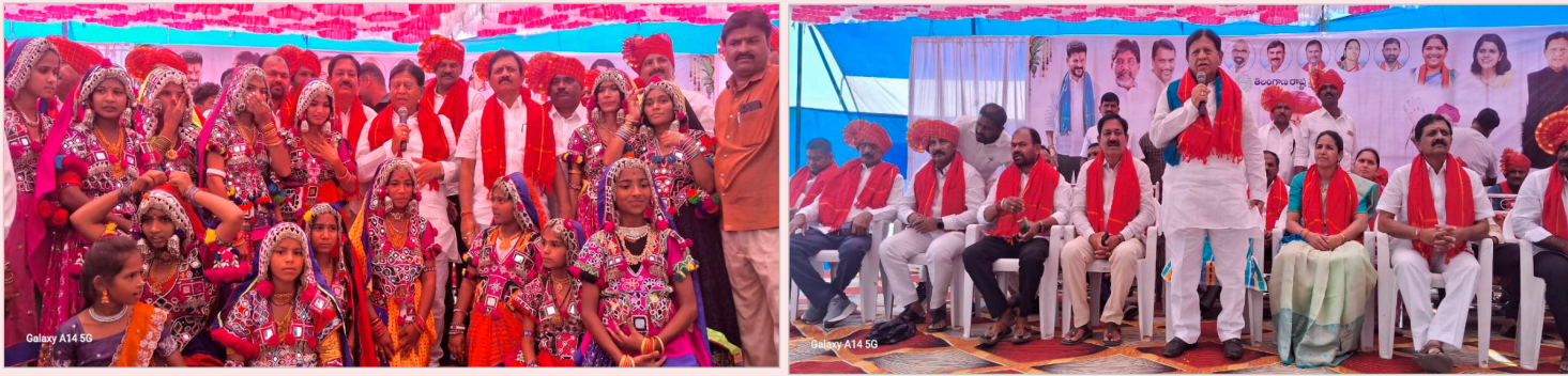
బోధన్: మార్చి 08 జన సంఘర్షణ