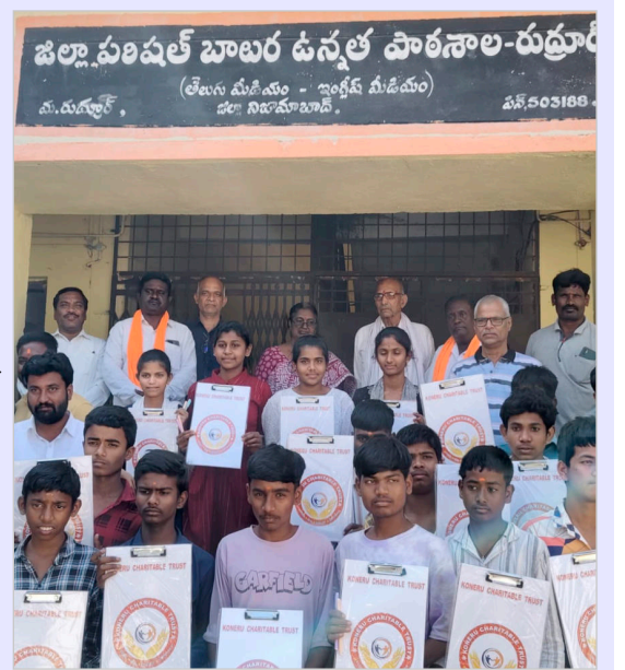
జిల్లా పరిషత్ బాలర ఉన్నత పాఠశాల-రుద్రాచలం (అవినీతి నిరోధక చర్యలకు భాగంగా) వద్ద 2026-03-09