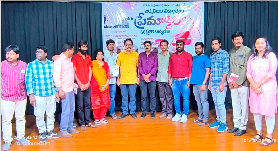
కాలానుగుణంగా సాహిత్య సాంస్కృతిక, సంప్రదాయాలలో మార్పులు