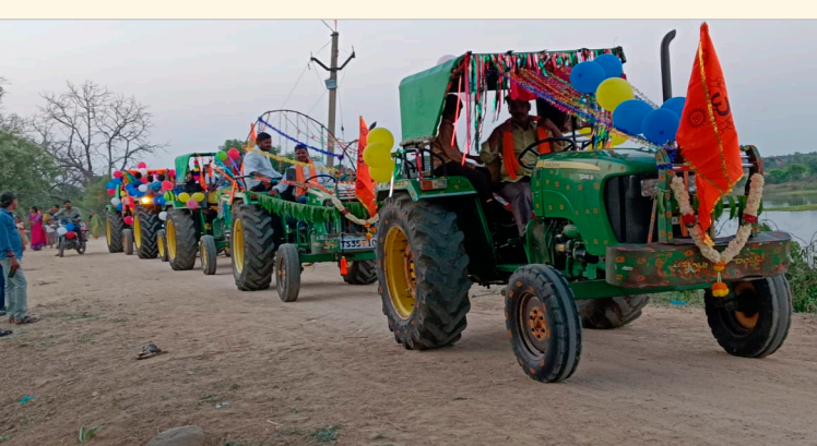
ఎల్లారెడ్డి, మార్చి -28 (జన సంఘర్షణ)