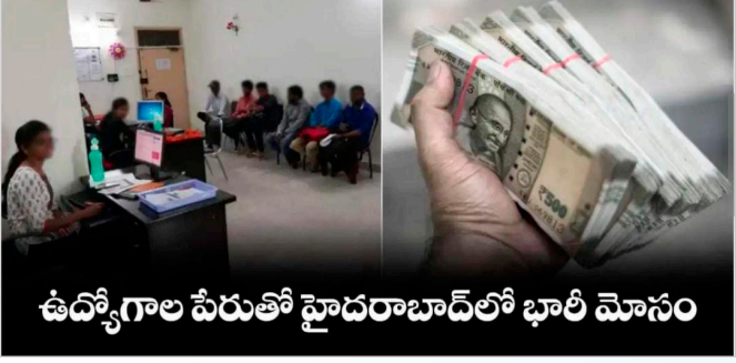
ఉద్యోగాల పేరుతో హైదరాబాద్ లో భారీ మోసం