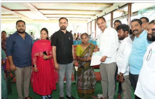
బీఆర్ఎస్ పార్టీ నాయకులు, కార్యకర్తలు తదితరులు పాల్గొన్నారు.