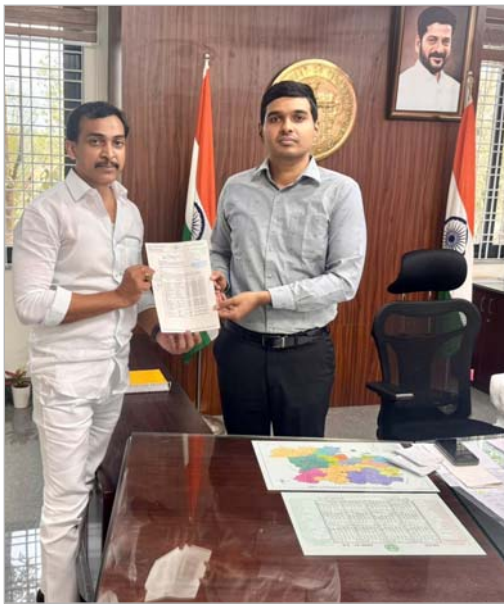
భూమిని కేటాయించడంతో పాటు భవన నిర్మాణానికి