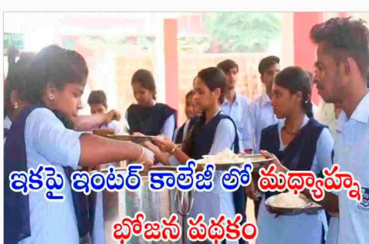
ఇకపై ఇంటర్ కాలేజీ లో ముద్దాపూర్ భోజన పథకం

తెలంగాణ రాష్ట్ర కేబినెట్ పలు కీలక నిర్ణయాలు తీసుకుంది. రాష్ట్రంలోని అన్ని జూనియర్ కాలేజీల్లో చదివే విద్యార్థులకు ముద్దాపూర్ భోజన పథకాన్ని అమలు చేయాలని కేబినెట్ ఆమోదం తెలిపింది. శనివారం జరిగిన కేబినెట్ సమావేశం అనంతరం మంత్రి పొంగులేటి శ్రీనివాస్ రెడ్డి మీడియాతో మాట్లాడారు. రాష్ట్రంలోని 11వ, 12వ తరగతి విద్యార్థులకు ఈ పథకం అమలు చేయనున్నట్లు తెలిపారు. అలాగేఇందిరమ్మ ఇళ్ల రెండో దశలో భాగంగా మరో 2.50 లక్షల ఇళ్ల నిర్మాణానికి కేబినెట్ ఆమోదం తెలిపింది. మొదటి దశలో ఇప్పటికే రూ.22,500 కోట్ల వ్యయంతో 4.50 లక్షల ఇళ్లను ప్రభుత్వం మంజూరు చేసిందని మంత్రి వివరించారు. ప్రతి అసెంబ్లీ నియోజకవర్గానికి 2,000 ఇళ్ల చొప్పున కేటాయించనున్నట్లు తెలిపారు. హైదరాబాద్ పరిధిలోని 24 అసెంబ్లీ నియోజకవర్గాల్లో లోయర్ ఇన్ కమ్ గ్రూప్ ప్రజల కోసం మరో లక్ష ఇళ్ల నిర్మాణం చేపట్టాలని కేబినెట్ నిర్ణయించింది. ఇకరాష్ట్రాన్ని ప్రపంచ స్థాయి లైఫ్ సైన్స్ హాల్ గా అభివృద్ధి చేయాలనే లక్ష్యంతో "నెక్స్ట్ జనరేషన్ లైఫ్ సైన్స్ పాలసీ 2026-30" కు కూడా కేబినెట్ ఆమోదం తెలిపింది. ఈ పాలసీ ద్వారా వచ్చే ఐదేళ్లలో 25 బిలియన్ డాలర్ల పెట్టుబడులు, 5 లక్షల ఉద్యోగాలు లక్ష్యంగా పెట్టుకున్నట్లు ప్రభుత్వం వెల్లడించింది కేంద్ర ప్రభుత్వం =బూనా పథకంలో రాష్ట్ర డిసెంబులు భాగస్వామ్యం కావడానికి కూడా కేబినెట్ అనుమతి ఇచ్చింది. విద్యుత్ పంపిణీ వ్యవస్థను మరింత బలోపేతం చేయడమే డీని లక్ష్యమని తెలిపారు. పాలమూరు-రంగారెడ్డి లిఫ్ట్ ఇరిగేషన్ ప్రాజెక్ట్ కోసం భూసేకరణ తదితర పనులకు రూ.587 కోట్ల మంజూరుకు కూడా కేబినెట్ ఆమోదం తెలిపింది.