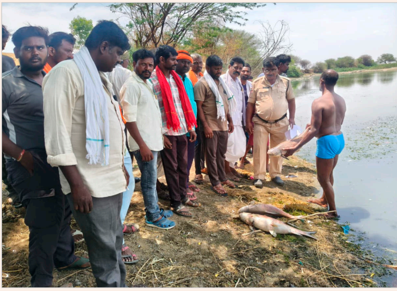
జల్లపల్లి/జూన్ 3/(జన సంఘరక్షణ)