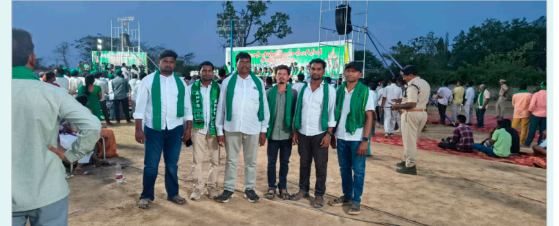
భద్రాద్రి కొత్తగూడెం జిల్లా, చర్ల, జూన్ 03 (జనసంఘరక్షణ):