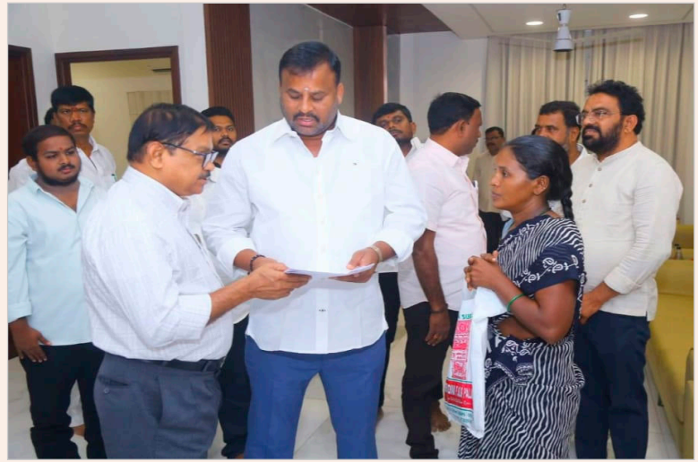
కుప్పం, జూన్ 03 (జనసంఘరక్షణ):

తాడేపల్లి లో మంత్రి రాంప్రసాద్ రెడ్డి ప్రజాదర్శార్ నిర్వహించారు. ప్రజల కష్టాలను నేరుగా తెలుసుకుని, వాటి త్వరితగతిన పరిష్కారానికి రాష్ట్ర రవాణా, యువజన, క్రీడాశాఖ మంత్రి మండిపల్లి రాంప్రసాద్ రెడ్డి తాడేపల్లి క్యాంపు కార్యాలయంలో 'ప్రజాదర్శార్' నిర్వహించారు. వివిధ ప్రాంతాల నుంచి తరలివచ్చిన ప్రజల నుంచి ఆయన స్వయంగా వినతులు స్వీకరించి, వారి సమస్యలను ఓర్చుగా విన్నారు. ప్రజలు ఎదుర్కొంటున్న పలు ఇబ్బందులపై అక్కడిక్కడే సంబంధిత అధికారులతో ఫోన్ ద్వారా మాట్లాడి, వెంటనే అవసరమైన చర్యలు తీసుకోవాలని ఆదేశించారు. ప్రజలకు వేగంగా సేవలు అందించేందుకు ప్రభుత్వం కట్టుబడి ఉందని, సమస్యల పరిష్కారానికి తాను ఎల్లప్పుడూ అందుబాటులో ఉంటానని మంత్రి స్పష్టం చేశారు.